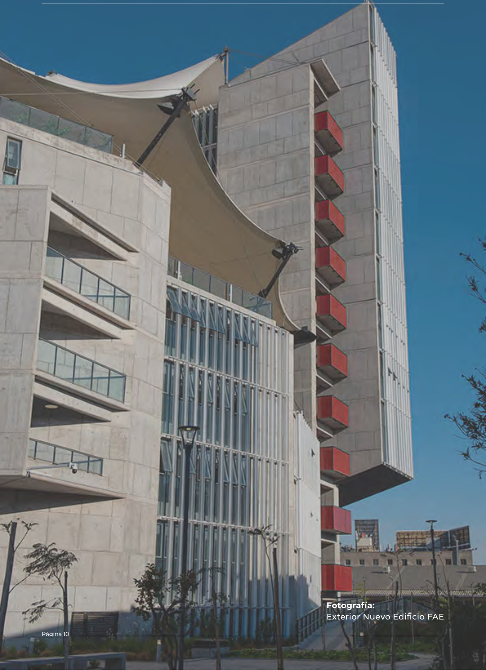
Fotografía: Exterior Nuevo Edificio FAE