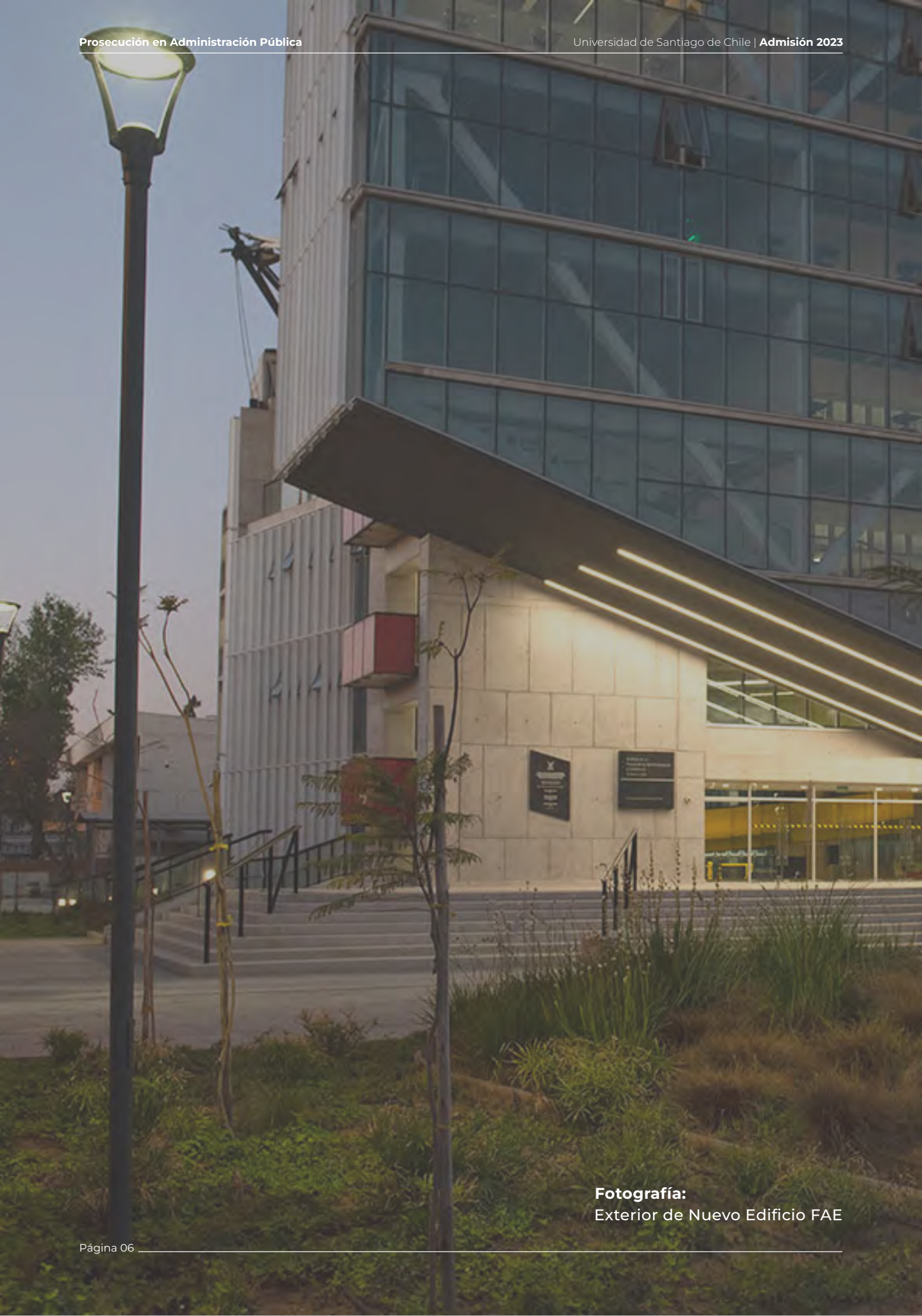
Fotografía: Exterior de Nuevo Edificio FAE